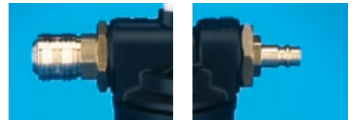
Schnellkupplungen (nicht bei Classic)

Auch geeignet für den Betrieb vor drucklosem Boiler! Nur mit Kaltwasser betreiben!