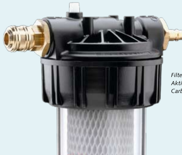
Filter made in Germany: Aktivkohlefilter »Vario« von Carbonit.

Die Gestaltung von »wasser & luft« sowie alle darin veröffentlichten Texte, Grafiken und Fotos unterliegen Urheberrechten. Kein Teil dieser Veröffentlichung darf außerhalb der engen Grenzen des Urheberrechts ohne Zustimmung des Herausgebers verwertet werden.