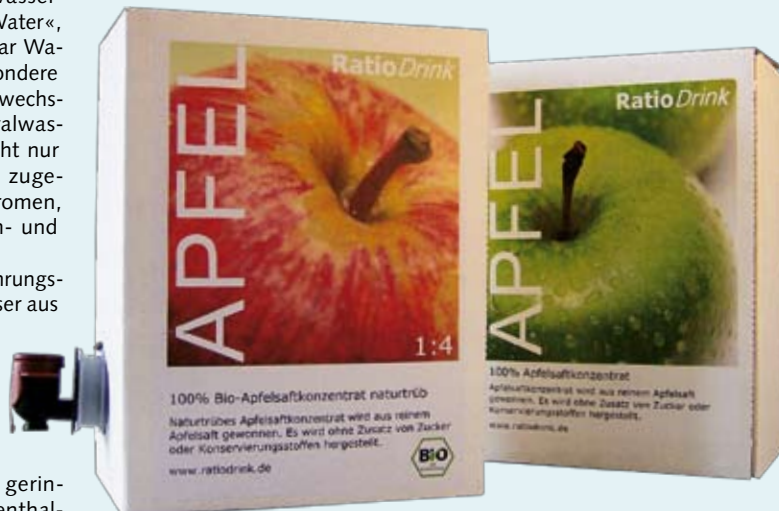
Natürliches Geschmackserlebnis: Biokonzentrate wie RatioDrink kommen ohne Fremdaromen oder Süßungsmittel aus.

die es in unzähligen – auch zuckerfreien – Geschmacksrichtungen gibt, schnell und unkompliziert zu eigenen schmackhaften Getränken mixen. Oft genügt es aber auch schon, eine Zitronen- oder Orangenscheibe, eine kleine Menge Fruchtsaft oder Tee ins Glas zu geben und mit Wasser aufzufüllen.