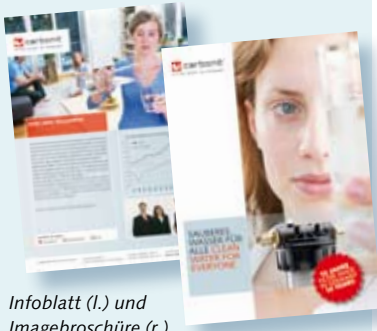
Infoblatt (l.) und Imagebroschüre (r.)